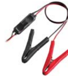
SM C36L - C36LT