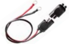
SM C36L - C36LT