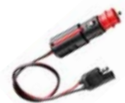
SM C36L 010135